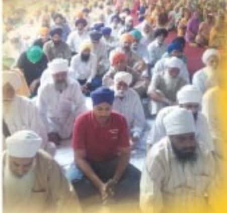
ਪੰਜਾਬੀ ਯੂਨੀਵਰਸਿਟੀ ਪਟਿਆਲਾ ਵਿਖੇ ਭਾਈ ਕੁਰਦਾਸ ਦੇ ਆਰ ਵੱਲੋਂ ਕਰਵਾਏ ਗਏ ਸੈਮੀਨਾਰ, "ਰਾਜ ਦਾ ਸਿੱਖ ਸੰਕਲਪ" ਅਤੇ ਭਾਈ ਸੁਪਰਿੰਟੈਂਡ ਸਿੱਖ ਚਰਚਾ ਸਾਹਿਬ ਸੰਬੰਧਿਤ ਕਰਦੇ ਹੋਏ।