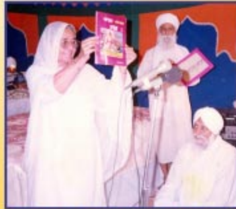
ਸਤਿਕਾਰਯੋਗ ਮਾਤਾ ਜੀ ਸੰਨ 1995 ਵਿੱਚ ਵਿਸਾਖੀ ਦੇ ਪਵਿੱਤਰ ਦਿਹਾੜੇ ਤੇ ਆਰਮ ਮਾਰਗ ਚਿਲੀਯ ਕਰਦੇ ਹੋਏ।

ਕੱਠੂ ਦੇ ਦੀਵਾਨ ਵਿਚ ਬੇਨਤੀ ਕੀਤੀ ਸੀ ਕਿ ਮਹਾਂਪੁਰਖਾਂ ਦਾ ਬਚਨ ਪ੍ਰੇਮੀਓਂ। ਤੁਹਾਡੀ ਬੀਬੀ ਜੀ ਨੇ ਸਾਡੇ ਤੋਂ ਬਚਨ ਲਿਆ ਹੈ ਕਿ ਜਦ ਆਪ ਜੀ ਦੇ ਅਨੰਦ