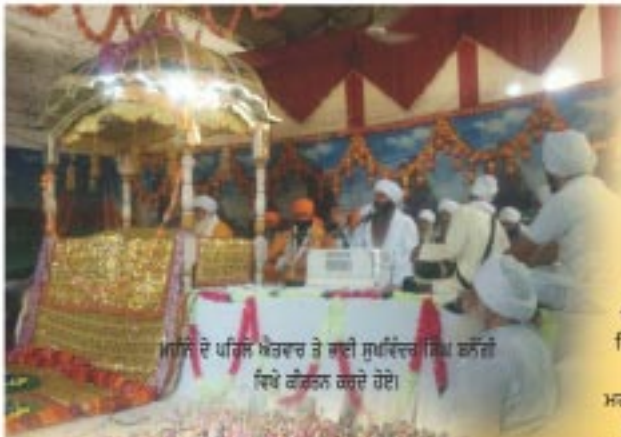
ਮਹਿੰਦੇ ਦੇ ਪਹਿਲੇ ਅੰਦਰ ਤੇ ਸ਼ਾਹੀ ਸੁਪਰਿੰਟੈਂਡ ਸਿੱਖ ਫੌਜੀ ਵਿਖੇ ਕੌਂਸਲਨ ਕਰਦੇ ਹੋਏ।